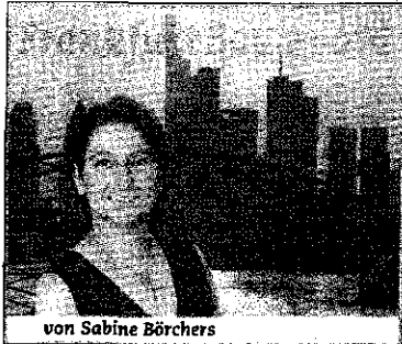
von Sabine Borchers

E s gibt Menschen, die durch ihre Taten beeindrucken. Die zeigen, was mit Willenskraft erreichbar ist und uns für einen Moment unsere kleinen all-