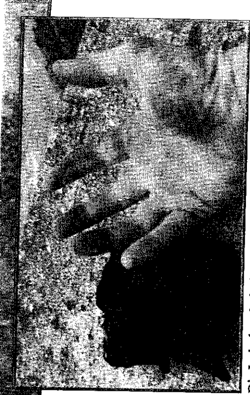
Die Lederhandschuhe aus dem Army-Shop verhindern die Blasen nicht. Nach 1200 Kilometern und 36 Tagen sind sie durchgewetzt.